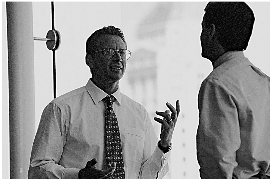
Les «adlates» soutiennent de jeunes entrepreneurs dans la création d'entreprises

Actuellement le réseau compte environ 430 professionnels provenant de divers domaines. Ils offrent un soutien aux petites et moyennes entreprises ainsi qu'aux administrations publiques lors de problèmes aigus. Selon les dires de M. Leuenberger, «adlat» signifie celui qui aide, qui se tient à vos côtés. C'est ainsi, comme «supporter» que se sentent les personnes faisant partie d'adlatus. L'orateur insiste qu'ils ne se sentent pas comme